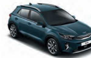
Denimblau Met. (EU3)