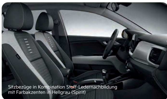
Sitzbezüge in Kombination Stoff-Ledernachbildung mit Farbakzenten in Hellgrau (Spirit)