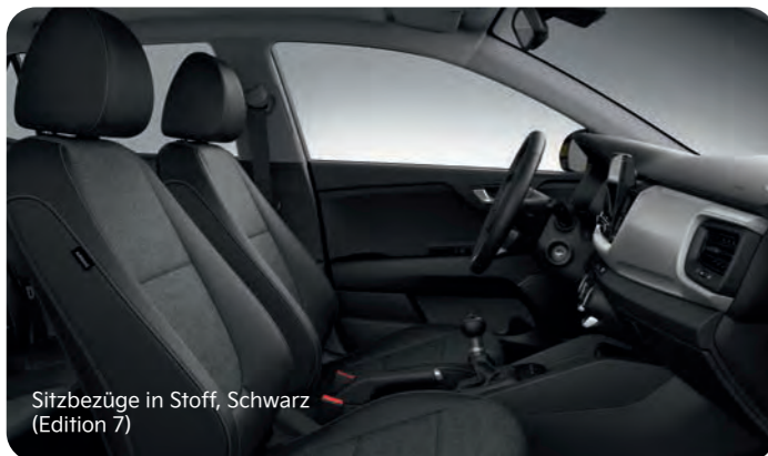
Sitzbezüge in Stoff, Schwarz (Edition 7)

Hier kannst du dich entspannen: für den Kia Stonic stehen Sitzbezüge aus Stoff oder Stoff in Kombination mit Ledernachbildung zur Wahl. Die Version Platinum bietet dir Sitze aus hochwertiger Ledernachbildung.