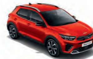
Signalrot Met. (BEG)