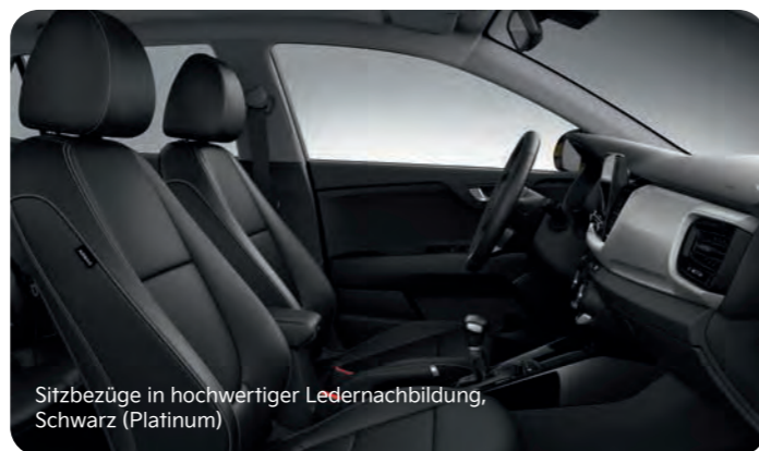
Sitzbezüge in hochwertiger Ledernachbildung, Schwarz (Platinum)