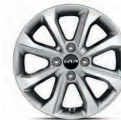
15-Zoll- Leichtmetallfelgen (Edition 7)