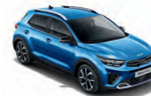
Bathysblau Met. (SPB)