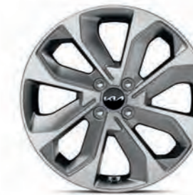
17-Zoll-Leichtmetallfelgen (Spirit, außer 1.2, und Platinum)