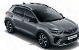
Perennialgrau Met. (PRG)