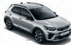
Seidensilber Met. (4SS)