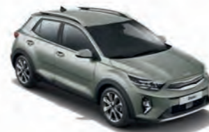
Urbangrün Met. (URG)