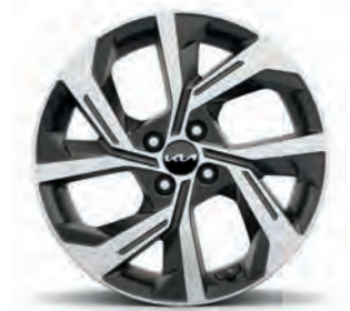
17-Zoll- Leichtmetallfelgen (GT-line)

Bei einigen unserer modernen Metallicfarben werden bewusst unterschiedliche Farbpigmente verwendet. Dadurch können unter bestimmten Lichtverhältnissen, z.B. direktes Sonnenlicht, attraktive Farbeffekte erzielt werden. Zum Teil kann die Farbe changieren, z.B. von Schwarz zu Dunkelblau. Bei den hier abgebildeten Farbdarstellungen kann es aufgrund der Drucktechnik zu Abweichungen zu den Originalfarben kommen. Weitere Informationen zu den Farbeffekten und Grundfarben erhältst du bei deinem Kia-Partner. Metalllackierungen sind aufpreispflichtig.