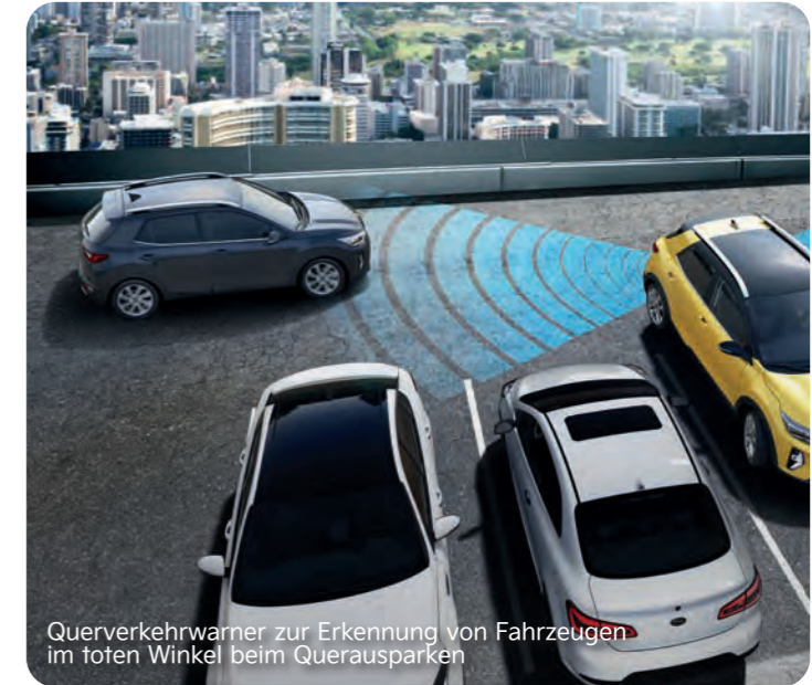
Querverkehrwarner zur Erkennung von Fahrzeugen im toten Winkel beim Querausparken

A Der Einsatz von Assistenz- oder Sicherheitssystemen entbindet nicht von der Notwendigkeit der Verkehrsbeobachtung.