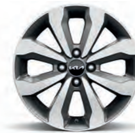
16-Zoll- Leichtmetallfelgen (Vision und 1.2 Spirit)