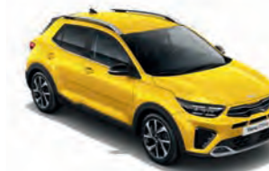
Floridagelb Met. (MYW)