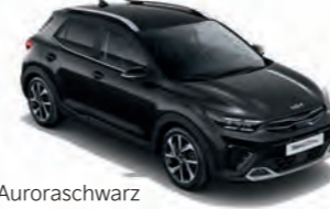
Auroraschwarz Met. (ABP)